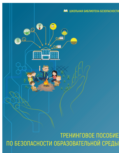
ТРЕНИНГОВОЕ ПОСОБИЕ ПО БЕЗОПАСНОСТИ ОБРАЗОВАТЕЛЬНОЙ СРЕДЫ