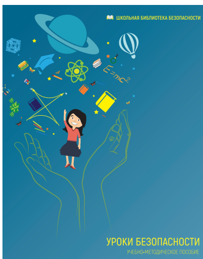
УРОКИ БЕЗОПАСНОСТИ Учебно-методическое пособие