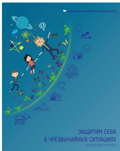
ЗАЩИТИМ СЕБЯ В ЧРЕЗВЫЧАЙНЫХ СИТУАЦИЯХ Пособие для учителей