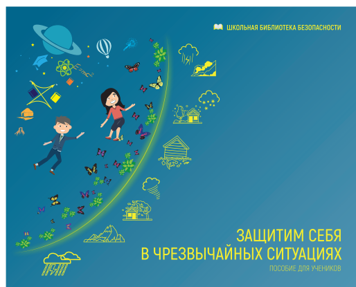
ЗАЩИТИМ СЕБЯ В ЧРЕЗВЫЧАЙНЫХ СИТУАЦИЯХ Пособие для учеников

ссылка на публикации: http://www.safe.edu.kg/publications