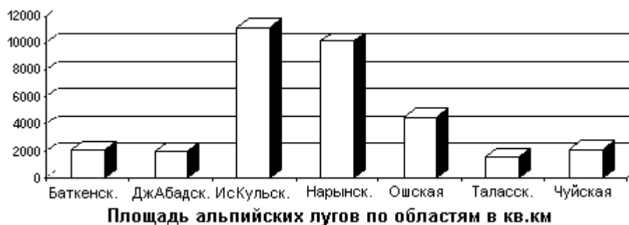
Рисунок 2. Распределение альпийских лугов по областям Кыргызстана

Как видно из рис. 2, альпийские сообщества наиболее широко представлены в Иссыккульской и Нарынской областях, в которых высокогорные пояса представлены значительными площадями.